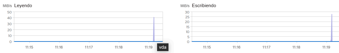
FIGURA 1: VISTA DE FLUJO DE DATOS

Los gráficos de la página Almacenamiento muestran el flujo de datos de lectura y escritura en los dispositivos. Cada dispositivo del gráfico tiene un color diferente. Pase el cursor sobre el pico de flujo de datos mostrado para identificar el nombre del dispositivo.