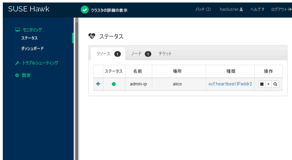
図 1: HAWK2の1ノードクラスタの状態