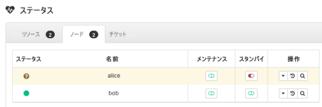
図 3: スタンバイモードのノードalice