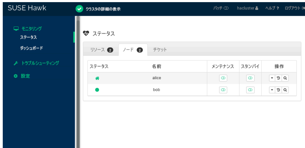
図 2: 2ノードクラスタの状態

Hawk2でクラスタの状態を確認します。ステータス > ノード に、2つのノードが緑色の状態で表示されます(図2「2ノードクラスタの状態」を参照してください)。